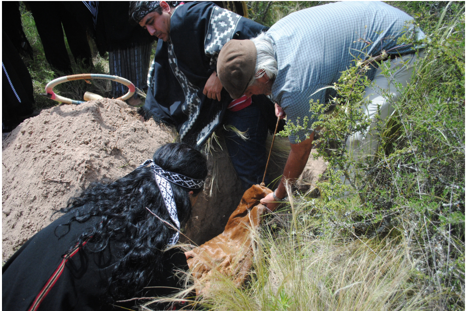
Figura 6. Ceremonia de reentierro en Loma de Chapalcó. Disposición en bolsa de cuero.