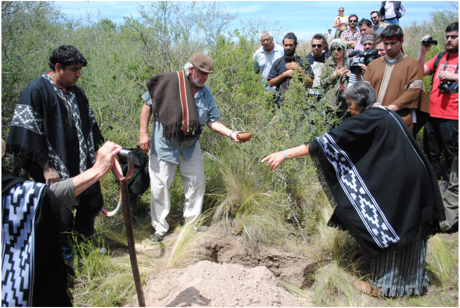
Figura 5. Ceremonia de reentierro en Loma de Chapalcó. Realización de ofrendas.