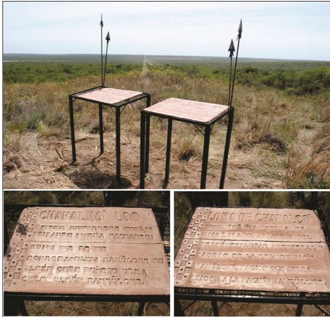
Figura 7. Marcación del lugar en rankülche-dungun: “Chapalkó Loo. Keitum kuivikeche 3090 AP ± 70 tripantu (wema vachantu). Kuivi we re we, monkomapuleli mamülche mu ulmén chem puñetu uema chem ulmén rankülche”; y en español: “Loma de Chapalcó. Cementerio indígena de 3090 AP ± 70 (Antes del presente). Lugar ancestral y sagrado de la cosmovisión mamülche, nación que diera origen a la nación rankülche”.