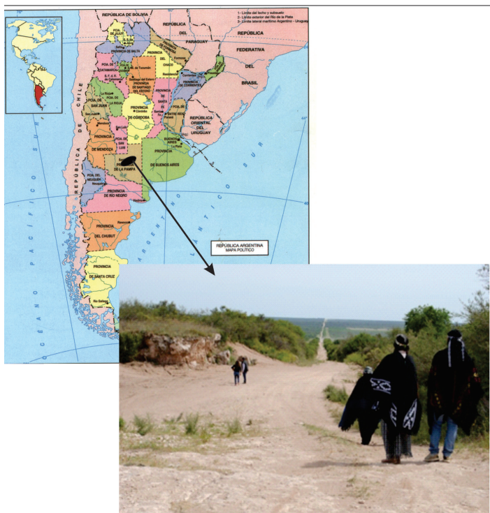
Figura 1. Ubicación relativa de Loma de Chapalcó, provincia de La Pampa, Argentina.