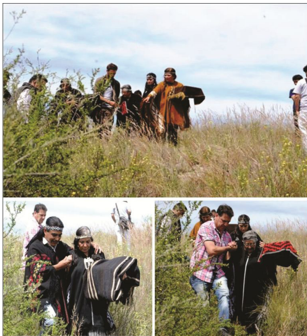
Figura 4. Ceremonia de reentierro en Loma de Chapalcó. Traslado de los cuerpos (2016).