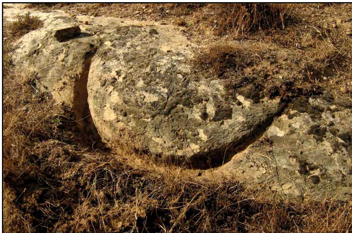
Figura 2. Grabado a la entrada de un castro prerromano en Val de San Lorenzo.

La Iglesia intentaría extirpar estas creencias paganas, tanto mediante la cooptación de la cultura material como por la explicación de los sitios arqueológicos a través de seres mitológicos cristianos. Por ejemplo, bajo los fosos de un castro en Val de San Lorenzo hay una piedra semienterrada con un grabado de una media luna de un metro de diámetro (Figura 2). La piedra, que no aparece en los inventarios arqueológicos, es bien conocida en el pueblo. El anciano que me llevó a conocerla afirmaba que se trataba de la pisada del caballo de Santiago Matamoros.