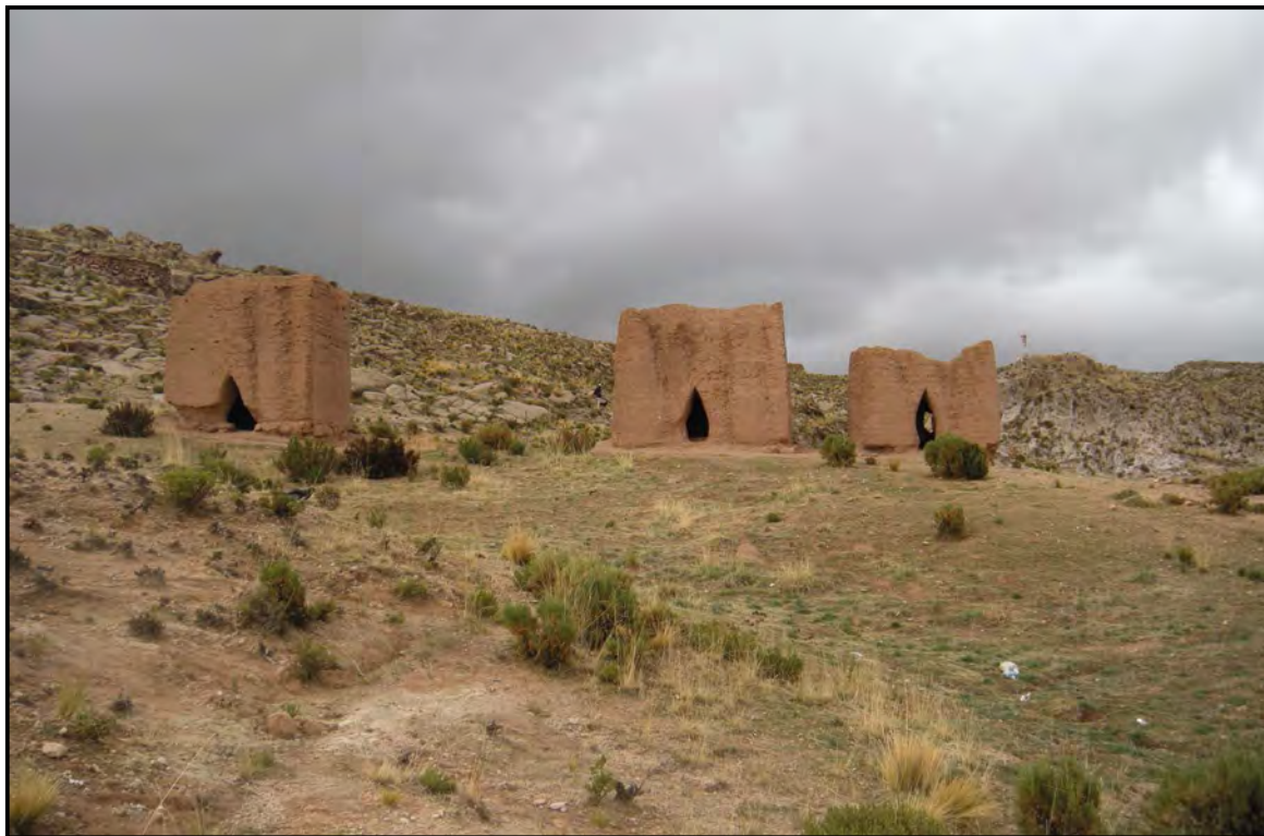
Figura 3. Remanentes de torres funerarias o chullpas en Curahuara de Carangas, Oruro.

Pero existen otras traducciones de chullpa . En su etnografía entre los chipayas del altiplano Intersalar, difundida verbalmente en 1931 y luego transcrita por Pauwels (1998, p. 68), Métraux provee la primera versión registrada del mito de los Chullpas: