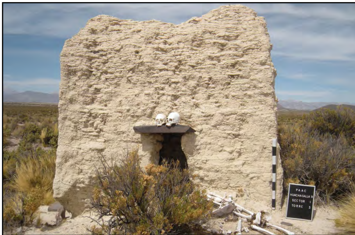
Figura 4. Cráneos de chullpas empleados en ceremonias contemporáneas en Florida, Oruro.

Recientemente, el gobierno del Movimiento Al Socialismo (MAS) promueve la refundación constitucional de Bolivia, reconociendo las cosmovisiones, prácticas y valores de las naciones indígenas. Los sindicatos agrarios se re-indigenizan, y el rol de autoridad indígena, con un capital político atractivo, es detentado por pobladores bien contactados con la cultura urbana de mercado y consumo. Coincidentemente, la última década ve la creciente patrimonialización de sitios arqueológicos, con apoyo estatal. Caso paradigmático, el willka kuti , celebración del solsticio de invierno iniciada en el sitio de Tiwanaku en los años setenta (Andia, 2012), actualmente convertida en feriado nacional y en escaparate turístico para los principales sitios arqueológicos del país.