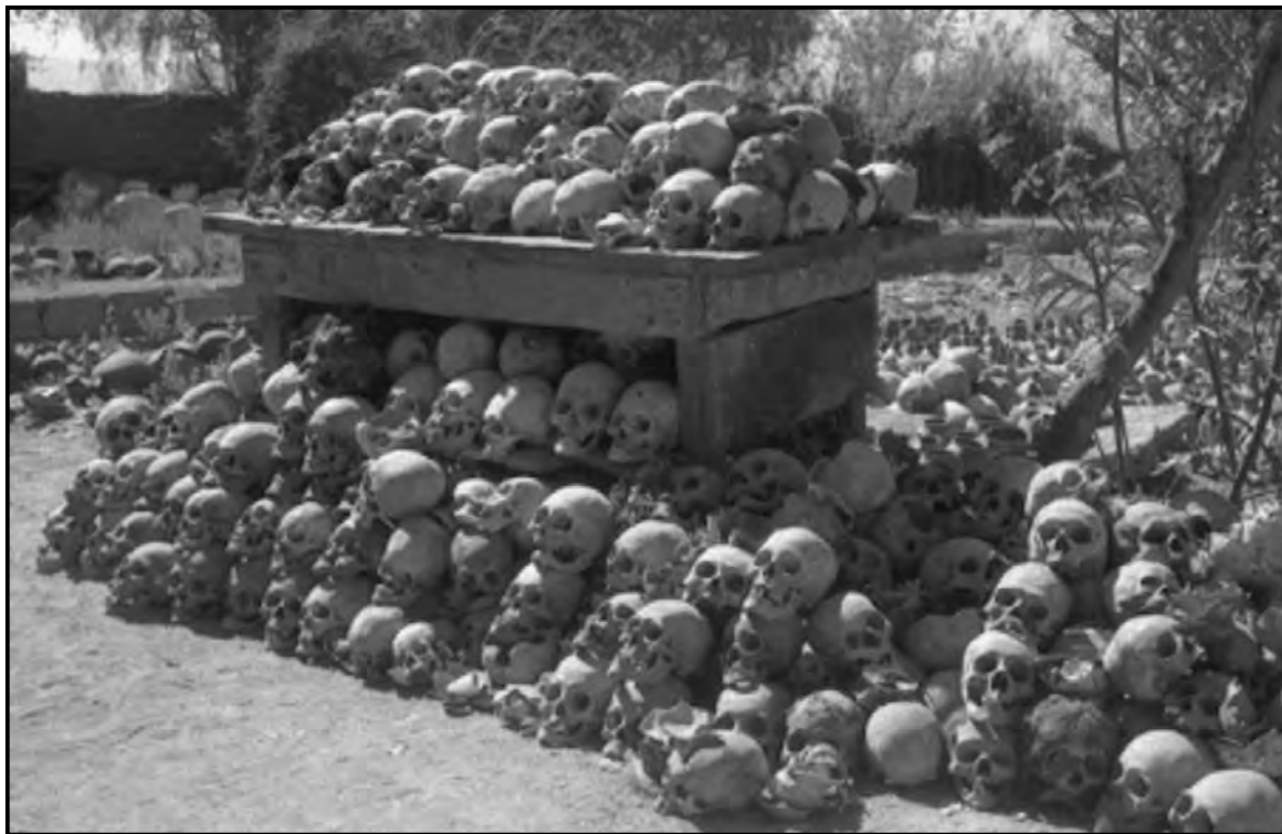
Figura 5. Colección de cráneos de los abuelos obtenida en las excavaciones de Gustavo Le Paige

Atacama por 26 años (para mayor información sobre Le Paige revisar Núñez, 1993; Ayala, 2008; Pavez, 2012). Durante este tiempo Le Paige excavó cientos de tumbas y sitios arqueológicos (Figura 5) sin considerar las percepciones locales referidas a los abuelos o gentiles, las cuales consideraba como supersticiones, razón por la cual en la actualidad su labor es criticada públicamente por los líderes étnicos (Ayala, 2008). Según uno de sus colaboradores atacameños, Le Paige “quería dar a conocer que los gentiles no hacían nada” (entrevista S. R., 2004), lo cual es interesante si se considera que el temor a los abuelos es producto de la acción cristiana, ya que Le Paige negó una creencia impuesta por su religión en su propio afán de excavar/extirpar idolatrías. Lo que aportó a cuestionar y cambiar una norma social de larga data en la cultura local. Si bien en algunas reuniones científicas se discutió la labor científica de Le Paige, sus sucesores continuaron excavando cementerios arqueológicos y reproduciendo relaciones coloniales de negación al ignorar y desconocer las percepciones atacameñas sobre los abuelos en San